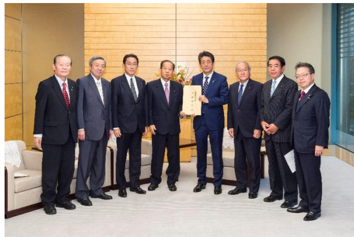
令和元年10月29日(火) 令和元年台風19号非常災害対策本部