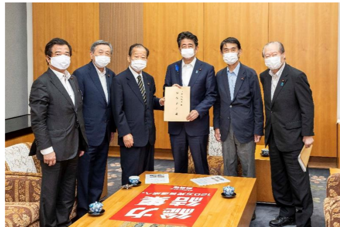
令和2年7月10日(金) 国土強靱化推進本部及び令和2年豪雨災害対策本部